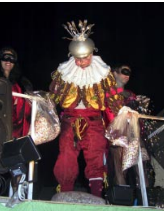
Festa del primer aniversari de l'associació