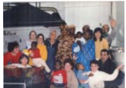
Cuinant per Canet Obert al món