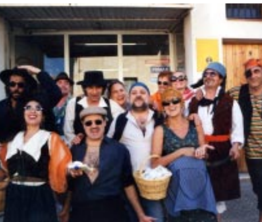
Passada de la festa dels barris

Cal dir també que durant tot aquest temps s'ha anat sensibilitzant i informant a la gent de Canet, mitjançant el butlletí de l'associació i fent ressò dels nostres objectius en els diferents actes organitzats.