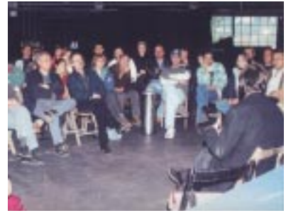
Primera assemblea de l'ACPO

Està organitzada en Comissions de tres nivells: de representació, d'estructura i de programació. A cada comissió hi ha com a mínim una persona de la Junta, per tal de facilitar la coordinació.