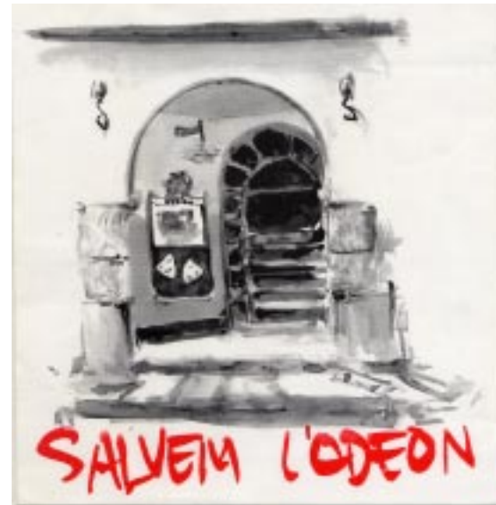
Enganxina de "Salvem l'Odeon"

EDUCAR LA POBLACIÓ EN ELS VALORS DE LA SOLIDARITAT, EL RESPECTE AL MEDI AMBIENT, LA DEFENSA DELS DRETS HUMANS, LA DEMOCRÀCIA I LA PLURALITAT